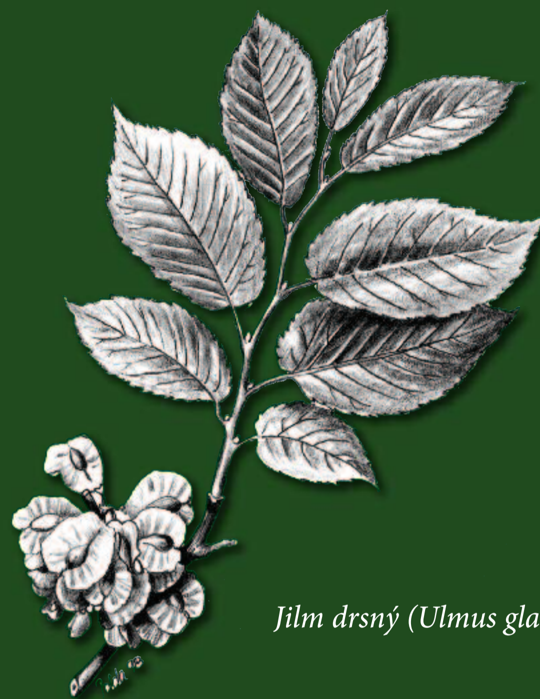
Jilm drsný ( Ulmus glabra )

Jilm drsný nebo také horský je statný až 40 m vysoký strom, kterému se daří ve stinných a suťových lesích. Dožívá se věku až 500 let. Trvanlivé jilmové dřevo se využívá ve stavebnictví, kolářství a k výrobě nábytku.